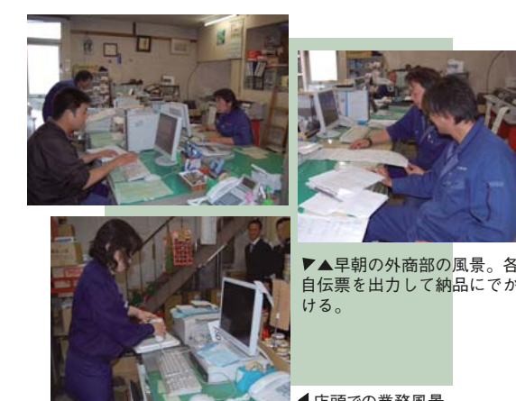
▲早朝の外商部の風景。各自伝票を出力して納品にでかける。 ▼店頭の業務風景。